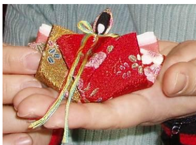
〈昨年の手作り体験の光景〉

日時：①二月十一日(土) ②二月十八日(土) ①、②共に十三時～十五時半 場所：仙台藩白老元陣屋資料館企画展示室 定員：①、②各十五名(ご予約が必要です) 費用：参加料無料(町民は入館料も無料です) 道具：はさみ、ぬい針、糸など(申し込みされた方には、別途資料を送らせていただきます)