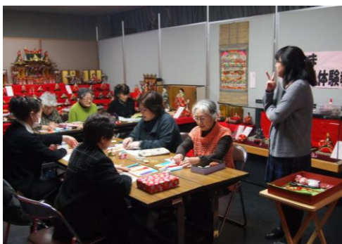
〈昨年の展示会の様子(左) 手作り体験教室の様子(右)〉