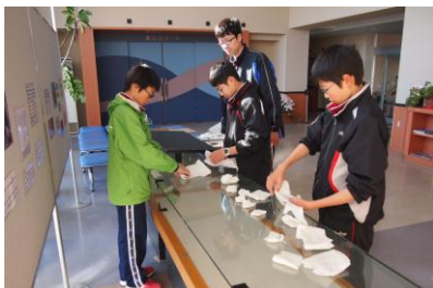
〈運んだ資料を、慎重に 取り出していく作業〉

きました。 これを機会 に町の歴史 や文化財へ の関心を深 めてもらえ ればと思い ます。