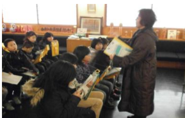
〈赤松の前で国際交流 メモする生徒(左) (右) 一生けん命に

また粉雪の舞う12月12日(木)には、アフガニスタンの留学生20名が来訪。史跡内の見学とよろい試着を体験し、「刺激的だった」との感想を残してくれました。藩士たちが北海道の寒さで苦労したエピソードに一同揃ってうなづくなど、実感とともに資料館を満喫してくれたようです。