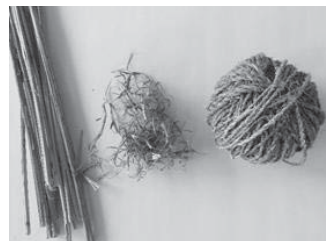
左からエゾイラクサの 枯れ茎、繊維、糸玉

チキサニでは昨年10月末、森野地区にてエゾイラクサを採取しました。その後、茎を金づちで叩いて平らに割り、裏返しに折って中の肉を落として繊維を取り出す作業を行い、さらに繊維を白くするため、森野地区にて雪さらしにしました。雪さらしを終えると、次は繊維をひたすら糸にしていく、カエカという糸より作業が始まります。こうした気が遠くなるような手間と時間が必要とされる作業を経ることで、ようやくさまざまな生活用具の材料となる糸が生み出されるのです。今回、制作する糸は今後の体験交流事業にて活用する予定です。