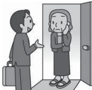
消費者庁 イラスト集から

業者が突然家に来て「だいぶ、傷んでいる」と屋根の塗装を勧められた。色々理由をつけて帰ってもらったが、その後何度も来るようになった。業者に頼むつもりはないが強い口調で契約を迫るので、自分では断り切れなかった。