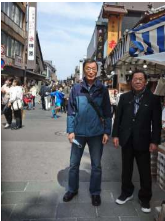
おほらい町・おかげ横丁