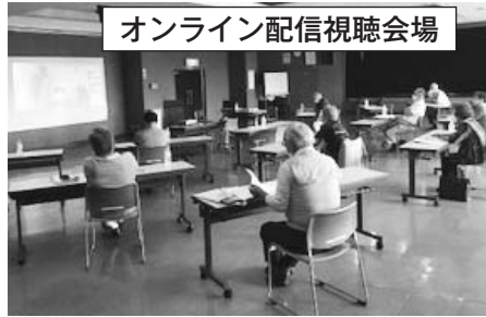
オンライン配信視聴会場

本会からは、オンライン配信に、個別もしくは、開設した白老コミセン201号室の視聴会場に、計14名が参加しました。(町連合事務局)