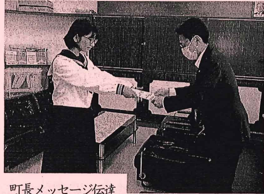
町長メッセージ伝達