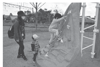
クリフクライマー