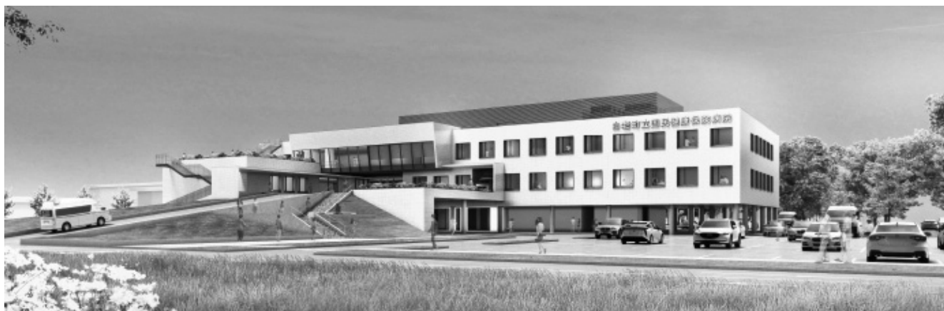
外観イメージ (提案イメージですので、色・デザインなどは今後の設計により変更となる場合があります)

町立病院改築事業は、公募型プロポーザルにより「フジタ・久米設計・岩倉建設・岩崎組特定建設工事共同企業体」を選定し、1月26日(水)に基本協定を締結しました。今後は設計施工一括発注方式(デザインビルド)により、早期改築を目指していきます。以下に新病院の概要を紹介します。