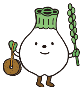
ウボボイ PR キャラクター 「トウレツポん」