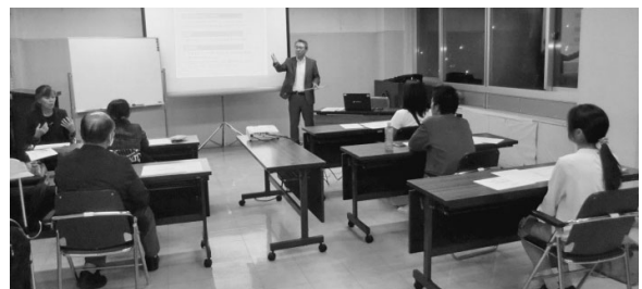
（白老町商工会 しらおい経済センター内 ☎82-2775）