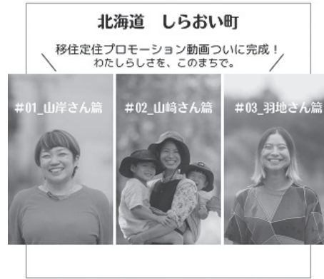
しらおい町移住ポータル動画紹介ページ

すてきな動画に仕上がりましたので、ぜひ、しらおい町移住ポータル( https://hokkaido-shiraoi.jp )からご覧ください。