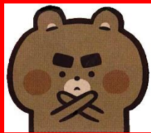
飲酒運転根絶アンバサダー やべーや