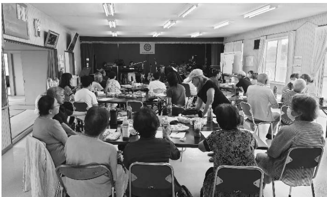
8月25日に竹浦ふれあい町内会をはじめ、地域の皆さんが第4回カラオケの集い夏祭りを開催した