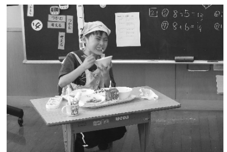
虎杖小のふるさと給食

地元の竹丸渋谷水産株式会社から12.5kgの食材提供を受けて約730食が用意されました。このうち、虎杖小学校では26人がふるさとの味に舌鼓を打ちました。