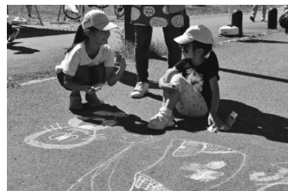
チョークアートを楽しむ子どもたち

グルメフェアには13店舗が出店。白老牛の串焼きや和菓子の販売のほか、キッチンカーもお目見えし、町民らでにぎわいました。