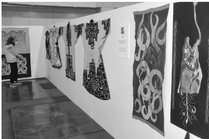
「ウタルニ～仲間とともに。刺しゅうにまつわる女性の手仕事」

アートプロジェクトは5年目の取り組みです。今回も文化庁の補助を受けて実施、白老の文化を町内外に発信しました。