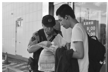
コープさっぽろパセオしらおいの街頭啓発

啓発には交通安全協会、交通安全指導員会、交通安全町民運動推進委員会などから8人が参加。「STOP！飲酒運転」のチラシやティッシュを配り、飲酒運転防止と交通ルールの順守を呼び掛けました。